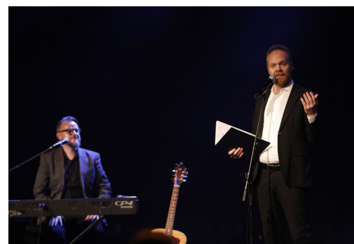
Det var god stemning på DnR-konferansen, som i år ble arrangert for tiende gang.