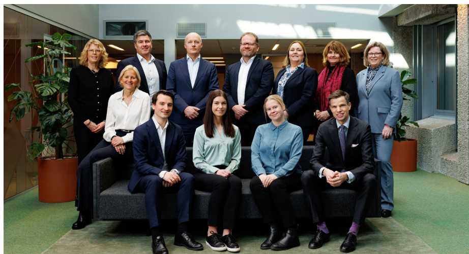
Styret hadde behandlet de nye navnene og kategoriene på flere møter før de ble vedtatt på Generalforsamlingen sommeren 2024.