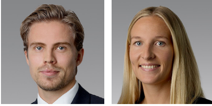
Siden er utarbeidet av skatterådgiverne Adrian Dobloug Høidabl og Synne Hurum Austmo, begge Deloitte Advokatfirma.