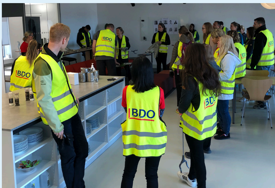
Alle som jobber på Jessheim-kontoret var ute og plukket søppel, bortsett fra en som er i permisjon.

Det hører med til historien at det ikke bare var BDO-ansatte på Jessheim som bidro til å gjøre lokalmiljøet bedre den dagen. 85 BDO-ansatte på Romerike var i aksjon over hele distriktet. De ansatte fikk lønn av selskapet for å bidra til lokalmiljøet i arbeidstiden, og de kunne også velge mellom å bidra med underholdning på eldrecenter eller dele ut mat og klær på Fattighuset.