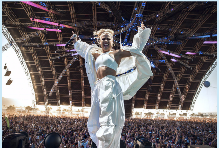
Vi avslutter Revisortreffet med konsert med Julie Bergan og band.