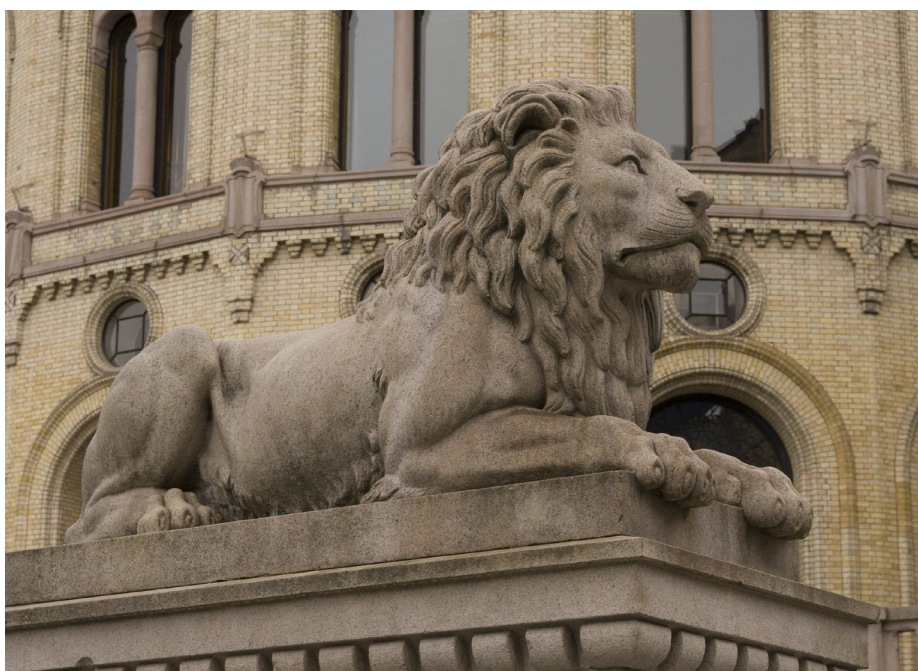
De store overskuddene i vår offentlige sektor gir oss en enorm handlefrihet til å gjøre hva vi vil med skatter og avgifter. Det er altså ingen statsfinansielle grunner til å øke skattene.

Litt oppsummert kan en si at det er mangelen på arbeidskraft som er vår største utfordring i år. En mangel som har blitt verre som følge av at vi ønsker å redusere arbeidsinnvandringen, samt