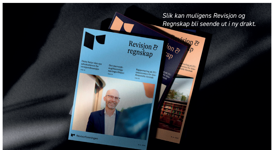
Slik kan muligens Revisjon og Regnskap bli seende ut i ny drakt.