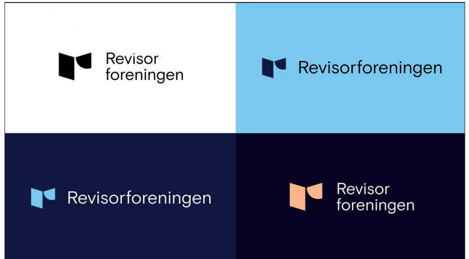
Ny logo sammen med Revisorforeningen

Hun poengterer viktigheten av at hele bransjen jobber sammen om å vise hvor gøy og lærerikt det er å jobbe i revisjon. – Vi er ofte ute og møter medlemmer. Tilbakemeldingen er slående – revisorene forteller at de er stolte over jobben de gjør, hverdagen er variert, lærerik og sosial. De opplever at de bidrar til å gjøre kundene sine bedre. Det gir økt gevinst for næringslivet og samfunnet. Samtidig oppgir mange unge at de tror yrket begrenser muligheter, er ensformig og lite sosialt.