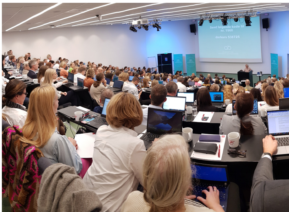
Første kull av Akademiet for bærekraftsrapportering møttes for første gang på Thon Conference Vika Atrium i Oslo.

Anslagsvis 1800 norske selskaper vil være direkte omfattet av Bærekraftsdirektivet, som er en betydelig utvidelse fra gjeldende lovgivning.