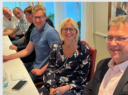
Revisorforeningen samlet studielederne for masterstudiene i revisjon og regnskap på Gardermoen. Her fra middagen torsdag kveld.

Utdanningsstilbudet i bærekraftsrapportering var et hovedtema. Det kommende direktivet om rapportering av bærekraft (CSRD) stiller krav til både rapportering og attestasjon av denne og må inn som obligatoriske deler av revisorutdanningen. Utdanningsinstitusjonene må allerede nå forberede hvordan studieplanene skal endres for å få plass til dette.