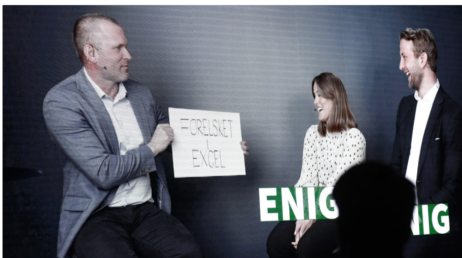
Her «avklares» også myter og sannheter om revisorene.

Interessen for arrangementet var over all forventning og de omkring 400 plassene ble raskt fylt opp og det måtte lages venteliste. En programkomité bestående av unge revisorer fra små og store revisjonsselskaper hadde satt sammen et aktuelt og variert program, med gode innlegg både fra eksterne og interne krefter. Og det slo an. Evalueringen gjennomført umiddelbart etter, viser at arrangementet traff godt både på aktualitet og sosialt.