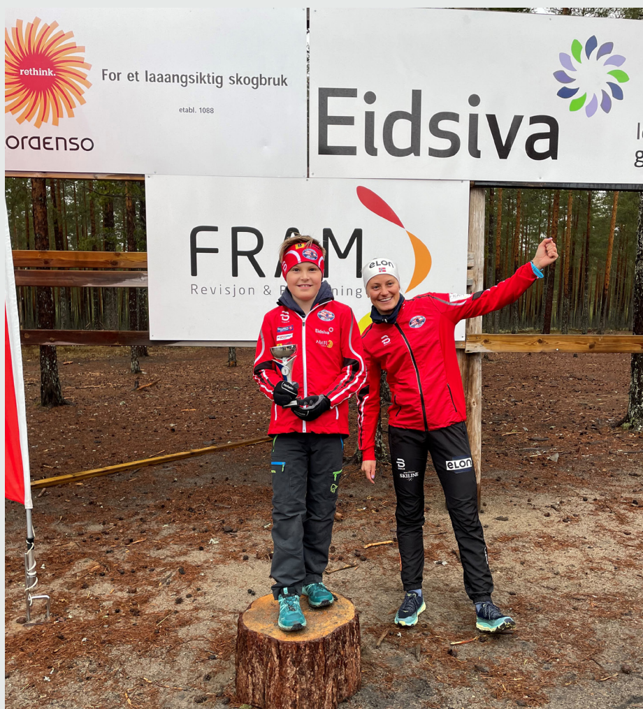
Fram Revisjon støtter blant annet Strandbygda IL.

RSM Norge har en tradisjon med å gi julegave til veldedige formål og de