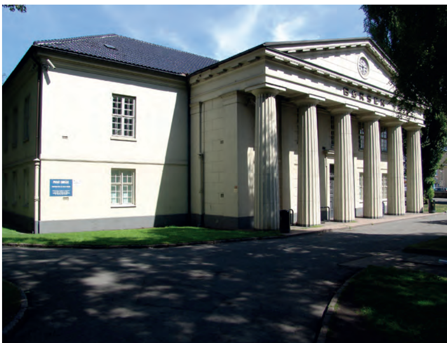
Oslo Børs ble i 2015 partner i FNs initiativ for bærekraftige børser.

for å oppnå en bedre rapportering om samfunnsansvar fra noterte selskaper. SSE omfatter p.t. 60 børser på verdensbasis, hvorav 16 børser pr. i dag har utarbeidet en veiledning om samfunnsansvarsrapportering.