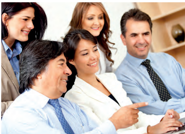
UNDERLAGT FINANSDEPARTEMENTET: Utvalget mener at det vil være best å opprette et ekspertorgan underlagt Finansdepartementet.

Ulempen med den foreslåtte modellen er at den representerer en hybrid av privat og statlig organisering som er ukjent i Norge. Dette kan representere økt risiko for å gjøre feil siden modellen er uprøvd. En slik risiko er ikke til stede hvis det velges en mer velkjent direktoratmodell. Utvalgets foreslåtte modell forutsetter en formell aksept av stifterne av Norsk RegnskapsStiftelse og en reell aksept i regnskapsmiljøet for å virke etter hensikten. En aktiv deltakelse fra regnskapsmiljøet i privat sektor anses som en nødvendig betingelse for godt standardsettingsarbeid. For øvrig understrekes det at fremtidig standardsetting vil forutsette statlig finansiering. Dette gjelder uavhengig av hvilken modell som velges.