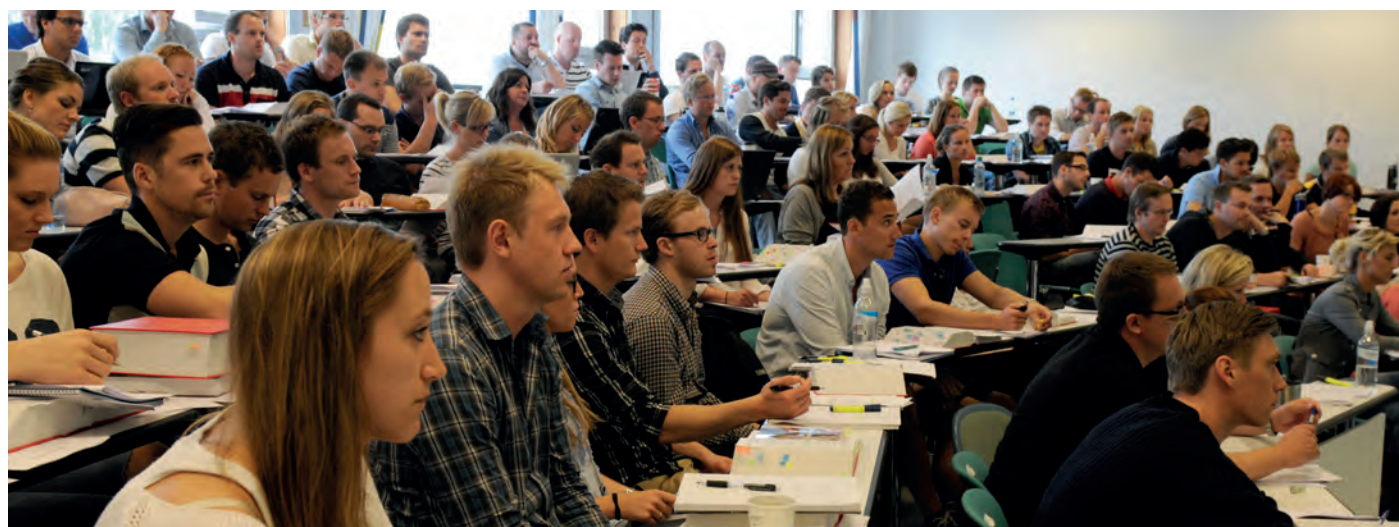
Dedikerte MRR-studenter ved NHH.