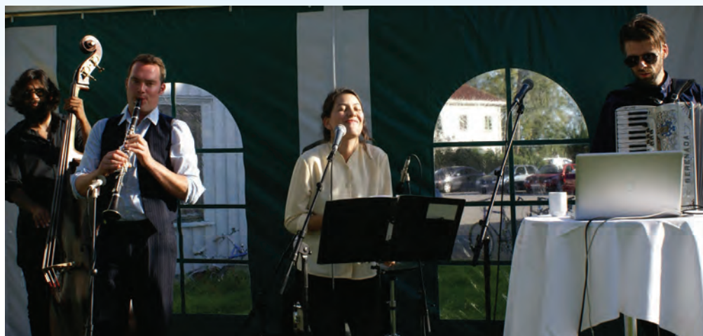
MUSIKK: Spennende musikk fra Goylem Space Kletzmer Band under mingletreffet.

veldig mye. Maskinene bruker ustrukturerte data fra mange kilder til for eksempel å forutsi utviklingen for et firma. Det interessante er at maskinene hele tiden blir bedre til å tolke ustrukturert informasjon. Dette må også påvirke måten revisorene kommer til å jobbe på i fremtiden, mente Pedersen.