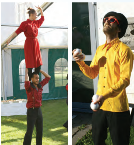
HØYT OG LAVT: Det ble gjøglet både på bakken og i høyden.