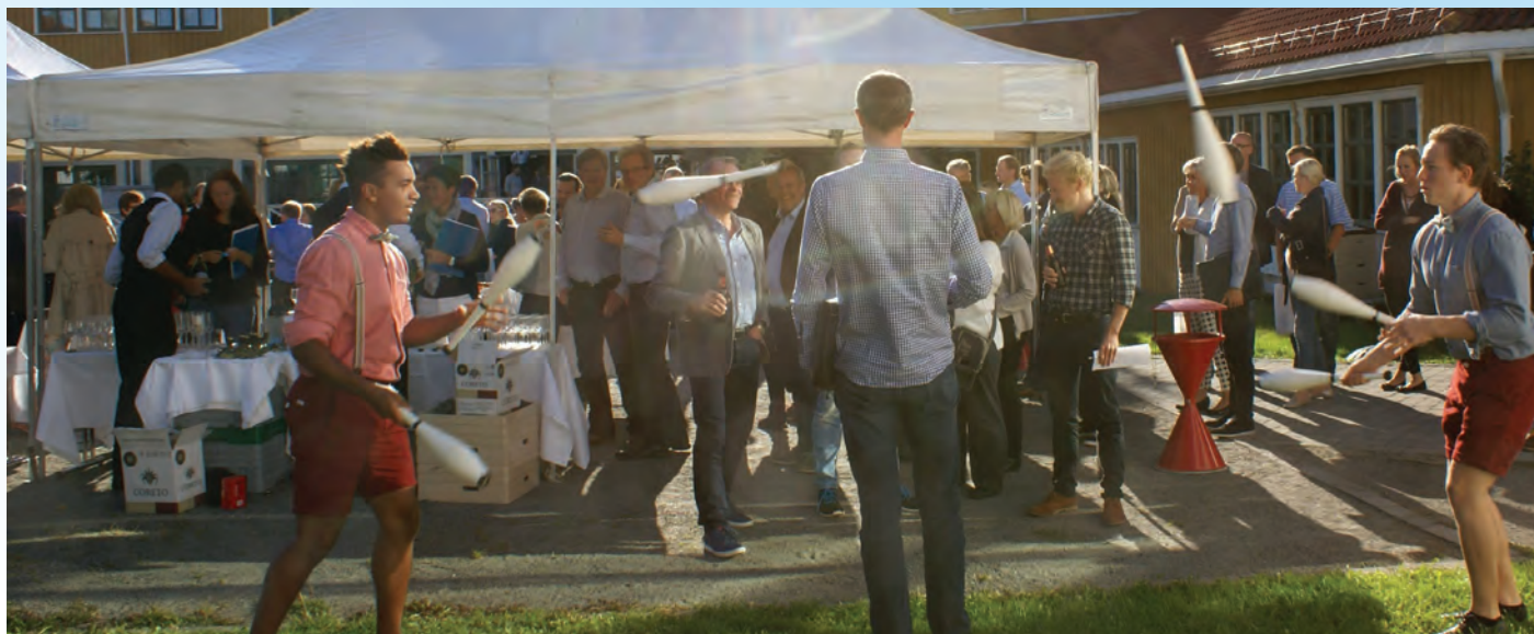
FANGET: Sjonglører fra gruppen Plutselig Sirkus «fanger» en av konferansedeltagerne mellom flyvende kjepler.