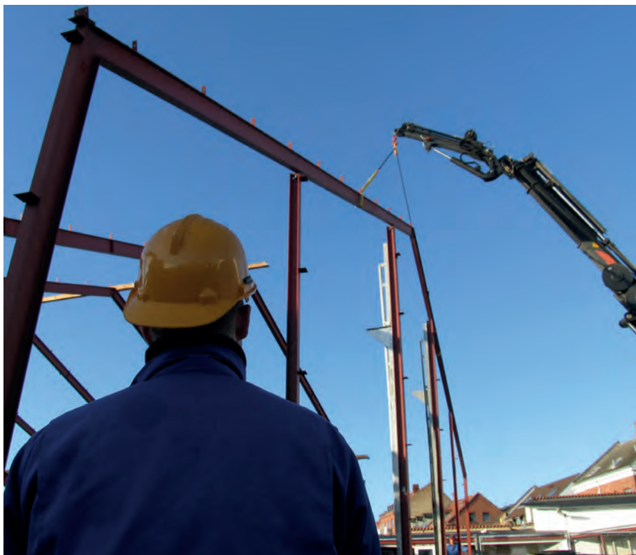
UTENLANDSK ARBEIDSKRAFT: Innen bygg og anlegg brukes det mye utenlandsk arbeidskraft.

Innenfor de tre ukene skal den solidaransvarlige altså avklare om vedkommende arbeidstaker har arbeidet på vedkommende prosjekt og i hvilke perioder, hvor mye lønn som skal etterbetales, hvilken skatt som skal trekkes, hvorvidt arbeids-