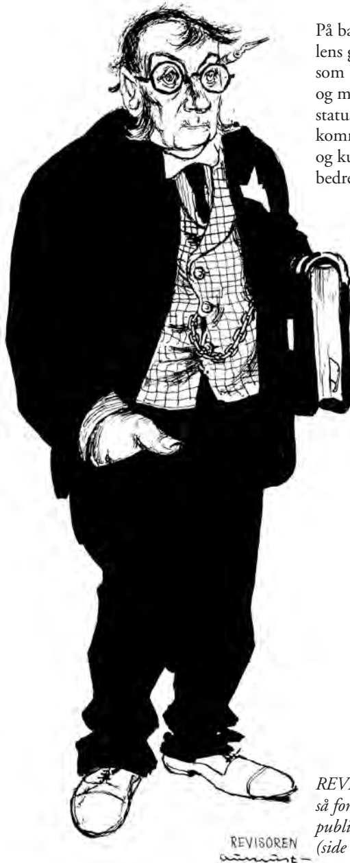
REVISOREN: Slik Kjell Aukrust i 1944 så for seg revisoren. Tegningen er tidligere publisert i Revisjon og Regnskap 5-1980 (side 183).

På bakrommet – back stage – avkledd rollens gevanter, er revisorene trivelige folk som beskytter sin profesjons koder. Etikk og moral er varemerket for profesjonens status og legitimitet. Varsomme med å komme i medias søkelys. Men spennende og kunnskapsrike fagfolk som fortjener et bedre omdømme.