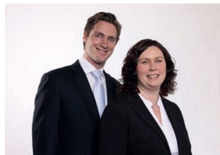
Sidene er utarbeidet av advokatfullmektig Morten Rivelesrud og advokatfullmektig Merethe Bryn, begge Deloitte Advokatfirma AS.

Finansdepartementet fastsatte 21. mai 2010 endringer i bokføringsforskriften som åpner for oppbevaring av elektronisk regnskapsmateriale i andre EØS-stater forutsatt at norske myndigheter gjennom overenskomst med den aktuelle stat er sikret tilstrekkelig adgang til materialet, og det kan hentes ut fra terminal i Norge.